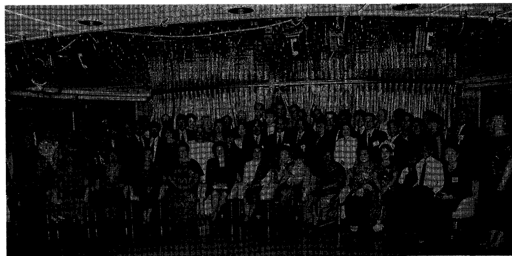
Royal Caribbean Cruise 船上での集合